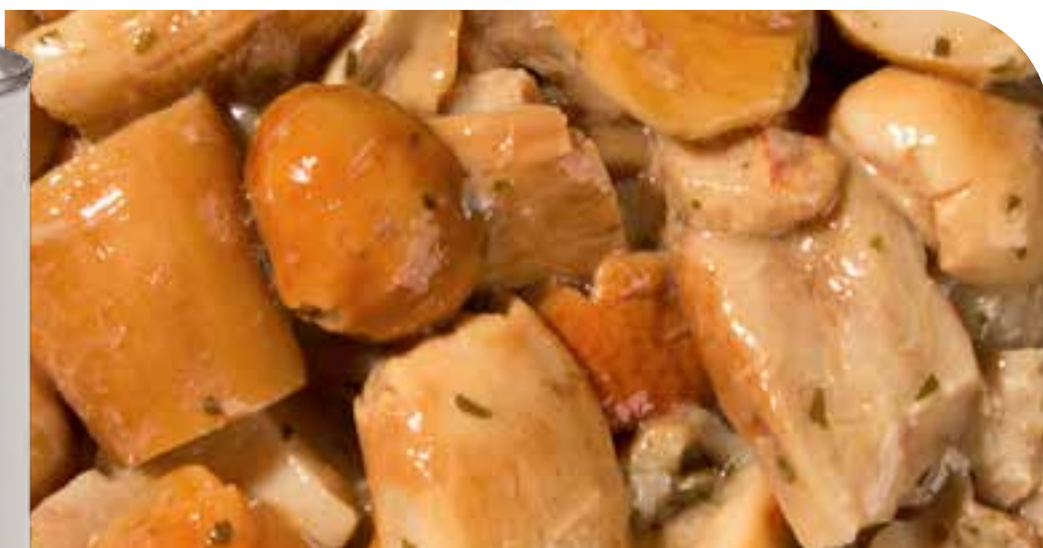
FUNGHI PORCINI TRIFOLATI