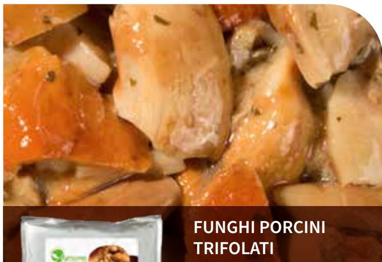
FUNGHI PORCINI TRIFOLATI