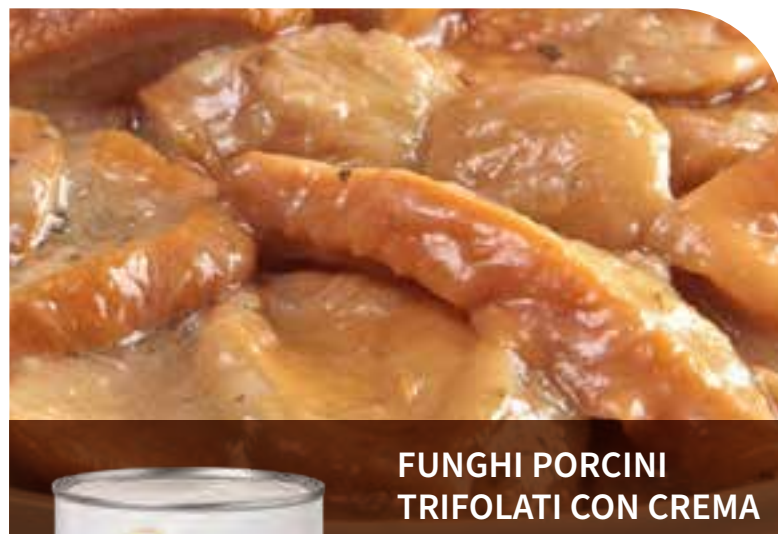
FUNGHI PORCINI TRIFOLATI CON CREMA